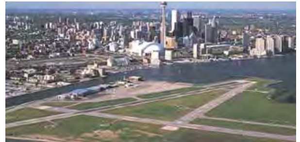
Toronto Port Authority

L'APH a été retenue par la Ville de Hamilton pour la gestion d'un important projet de dragage dans la partie est du havre, un rôle qui se traduit déjà par des économies considérables pour la ville. Des comparaisons entre le plan original d'élimination hors site et un site de mise en dépôt contrôlé proposé (CDF) ont déterminé que ce dernier représentait des économies de coûts estimatives de 4,35 millions $. Le projet révisé comprend le dépôt unique de matériau dragué directement dans le CDF de la jetée 27 de l'APH.